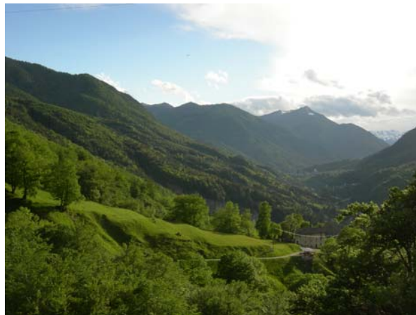
Aussicht von Monadello