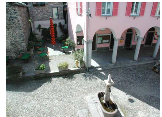
Aussicht aus dem Küchenfenster auf Piazza