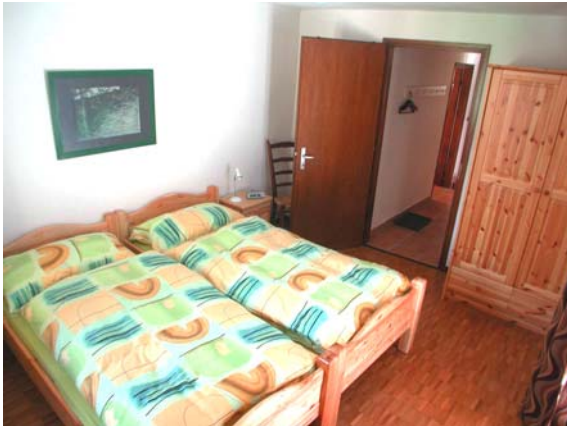
Doppelschlafzimmer mit 2 Einzelbetten