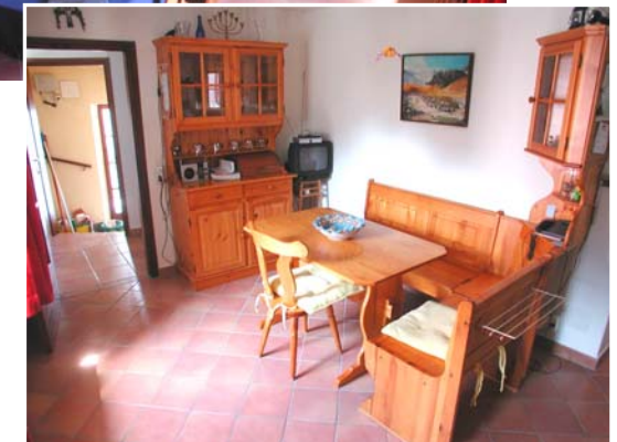
Neben Schrank TV mit Digitaldecoder.