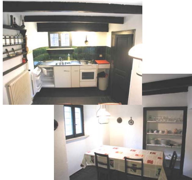
Einfache Einbauküche mit Elektro-Herd und grossem Esstisch mit Platz für 6 Personen.