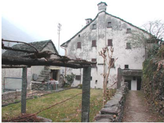
Blick vom Gartensitzplatz