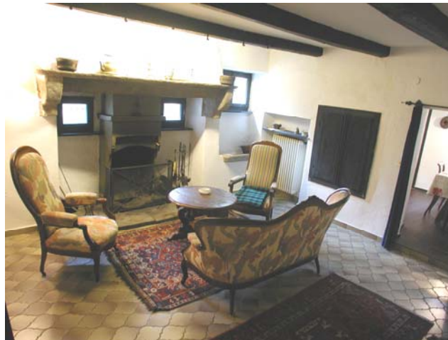
Wohnzimmer zum Wohlfühlen mit Kamin.