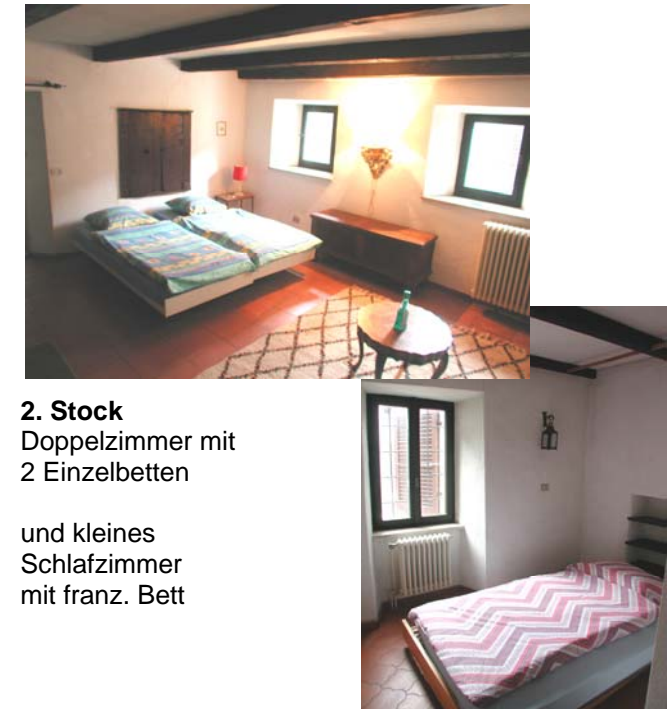
2. Stock Doppelzimmer mit 2 Einzelbetten