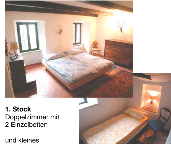
1. Stock Doppelzimmer mit 2 Einzelbetten