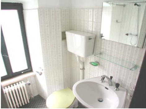
WC und Dusche im 1. und 2. Stockwerk Bei den Schlafräumen