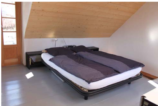
2 Zimmer Doppelbetten im Dachgeschoss.