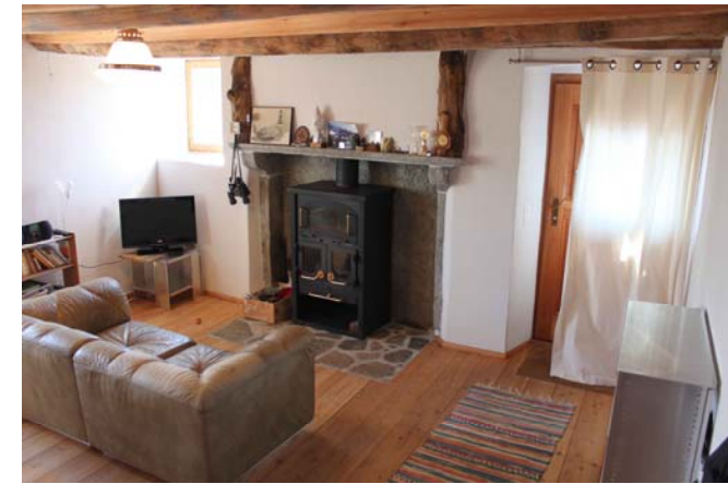
Gemütliche Sitzecke am Kamin