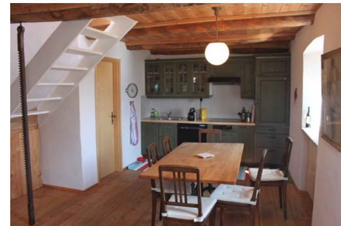
Wohnküche mit Esstisch