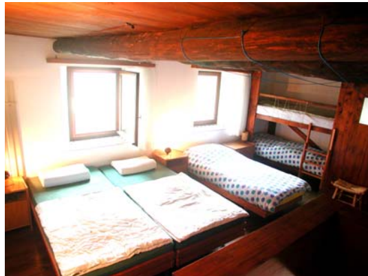
Grosses Schlafzimmer mit 3 Einzelbetten und 1 Kajütenbett