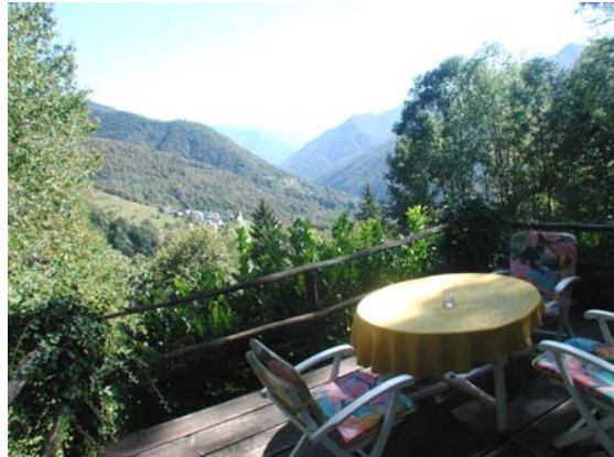
Balkon vor dem Haus mit herrlichem Panoramablick über Lionza ins Centovalli.