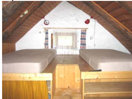
Gleich anschliessend, durch eine kleine Luke verbunden, befindet sich ein weiteres Schlafzimmer mit 2 Betten