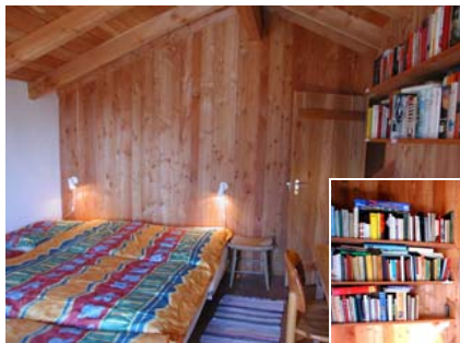
Schlafzimmer 3 Betten