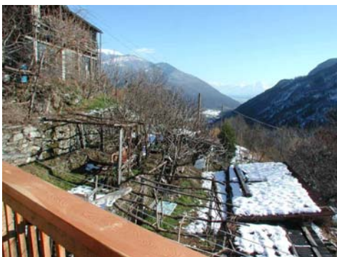
Schlafzimmerbalkon Casa Heidi Richtung Locarno