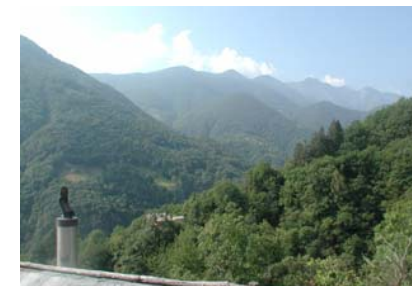
Balkon mit Panorama Richtung Centovalliberge

Zusatzzimmer im Untergeschoss mit Doppelbett für beide Wohnungen