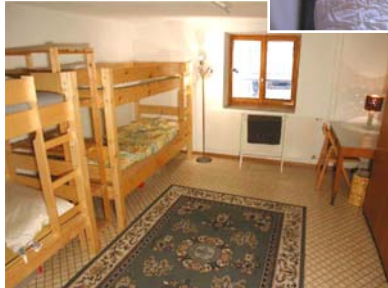
4er-Zi. mit Doppelstückbetten nahe Bad/Dusche WC