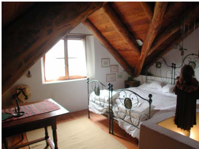
Doppelbett im Dachgeschoss