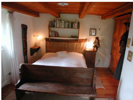
2 Schlafzimmer mit Doppelbetten im EG: