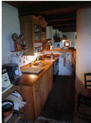
Küchenzeile mit Essecke