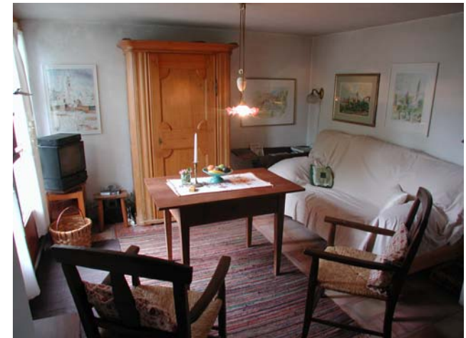
Gemütlicher Wohnraum mit Zugang zu einer Terrasse