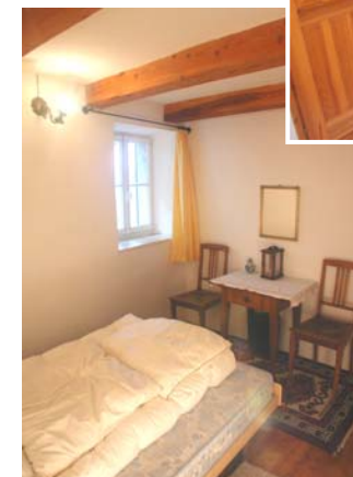
Doppelzimmer mit französischem Bett