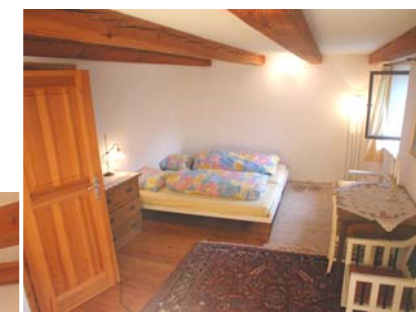
Doppelzimmer mit 2 Einzelbetten