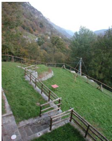
Aussicht vom Haus auf die Gartenterrassen