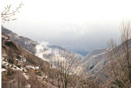
Aussicht ins Tal