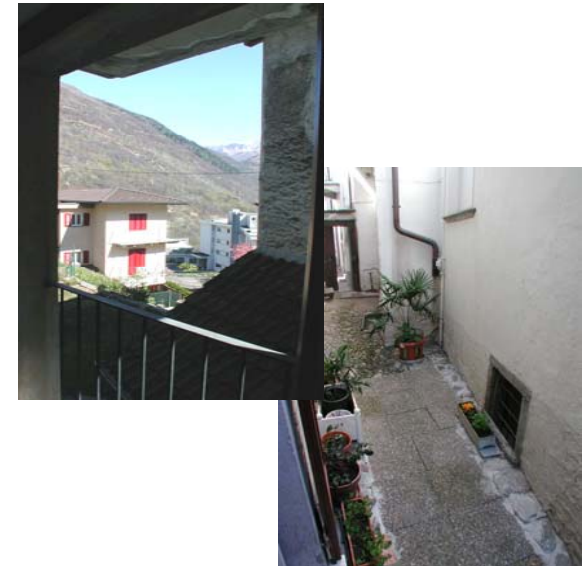
Hinter dem Haus kleiner Sitzplatz mit Tisch und Stühlen