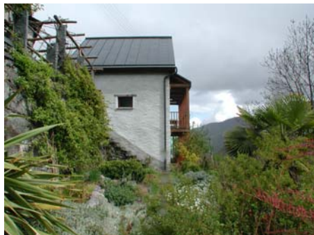
Blick vom Ziergarten Richtung Osten