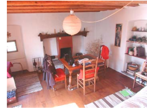
Wohnraum mit Kamin und ausziehbarer Doppelliege