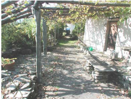
Gartensitzplatz / Terrasse / Pergola