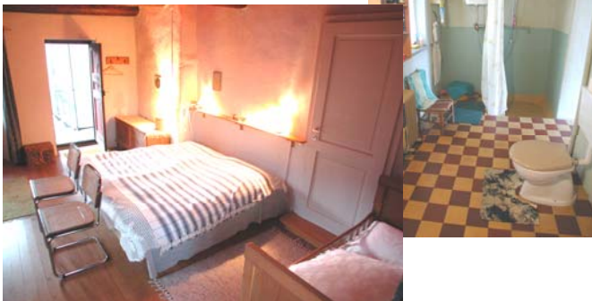
... zu Doppelzimmer mit Kinderbett