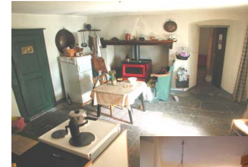
Küche mit Abstellraum und WC