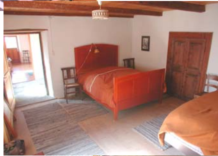
... und Zugang via Dusche/WC ...