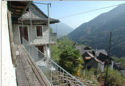
... und Zugang zu Balkon mit Berg-/ und Talsicht